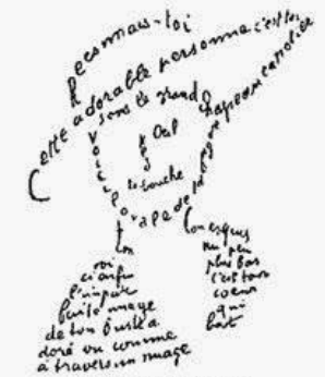
CALIGRAMA DE GUILLAUME APOLLINAIRE (1880-1918): POÈME 22, 9 FEBRERO DE 1915.