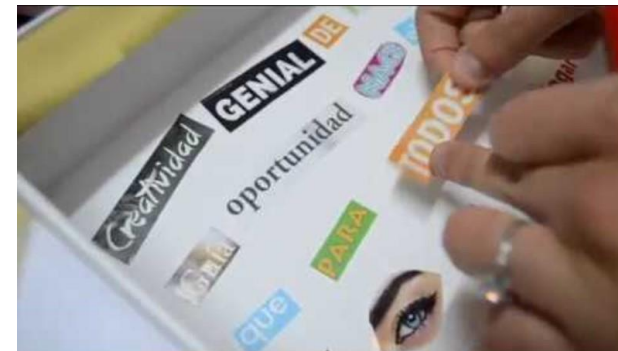
Cómo hacer un poema dadaísta