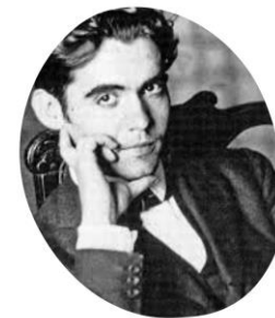
FEDERICO G. LORCA

Fuentevaqueros (Granada), 1898-Viznar (Granada), 1936. En la Residencia de Estudiantes concivió con otros artistas de su tiempo como Juan Ramón Jiménez, Rafael Alberti, Luis Buñuel y Salvador Dalí